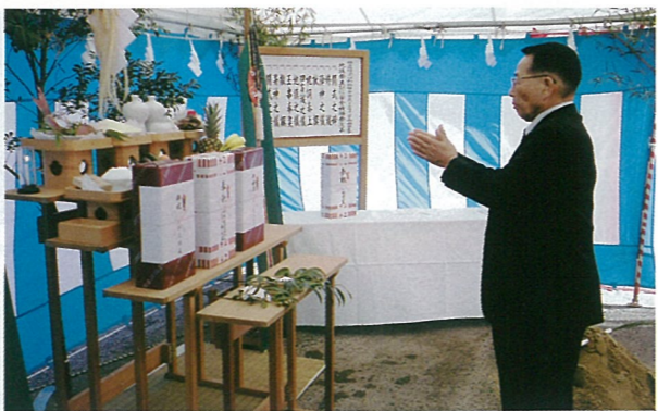
地鎮祭並びに工事安全祈願祭（平成25年9月26日）