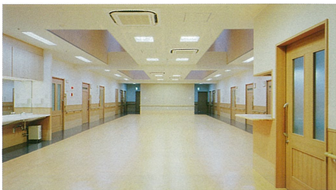
食堂・機能訓練室

これから寒い季節へと向かっていきます。皆様におかれましては、ご健康にご留意されますようお願い申し上げます。暖かいご支援を頂きますようお願い致します。