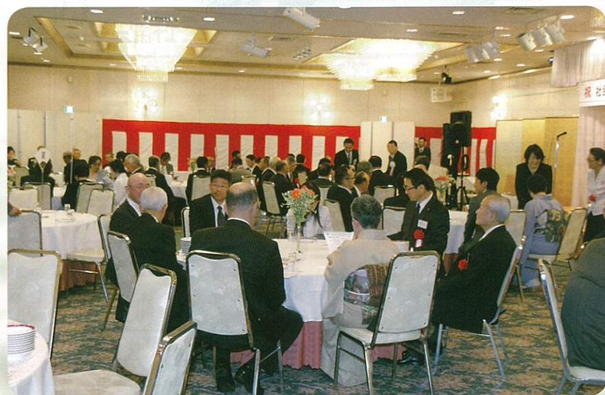
社会福祉法人人口和福祉会 20周年記念式典 平成26年5月18日 庄原グランドホテル