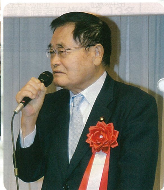
20周年記念式典祝辞 亀井静香衆議院議員