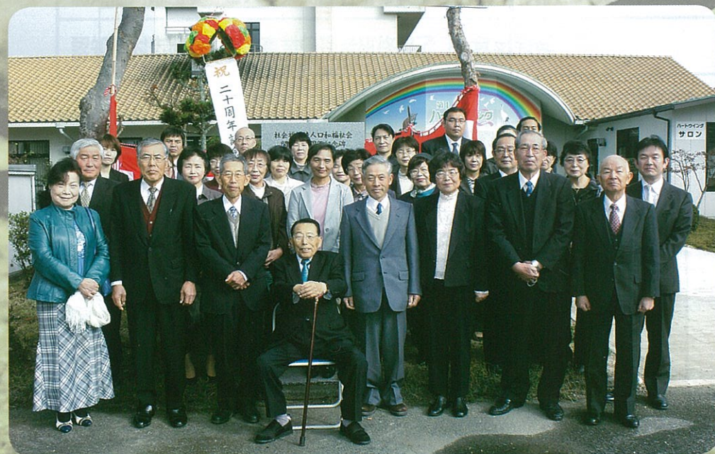
20周年記念碑を背景に 役員・係長一同