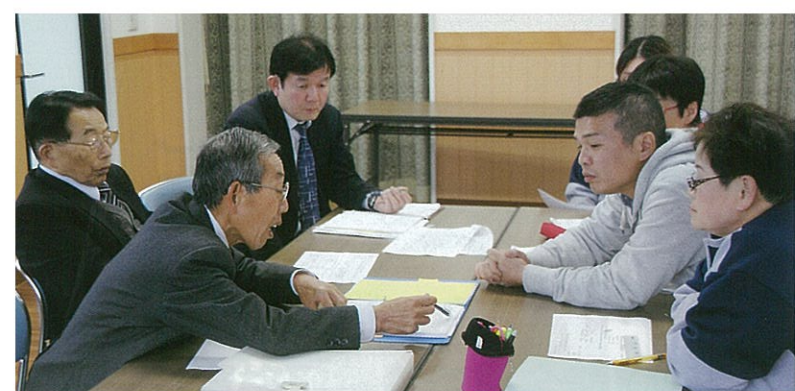
新執行部を交えての会議