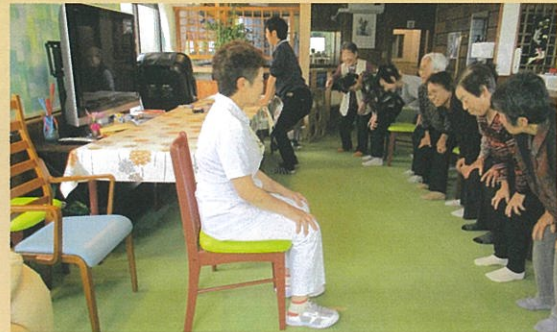
足腰きたえて今日もはじまります