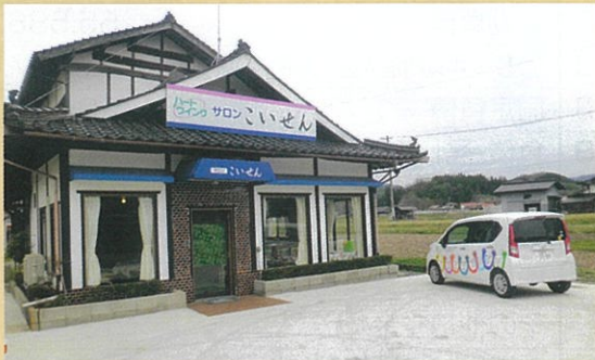
「こいせん」がよみがえりました。