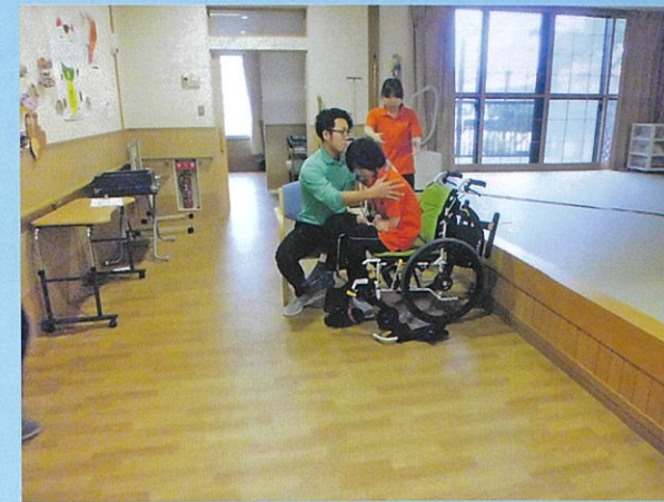
介護技術ワンポイント研修