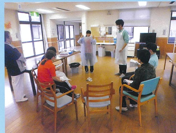
ノロウイルスおう吐物処理研修