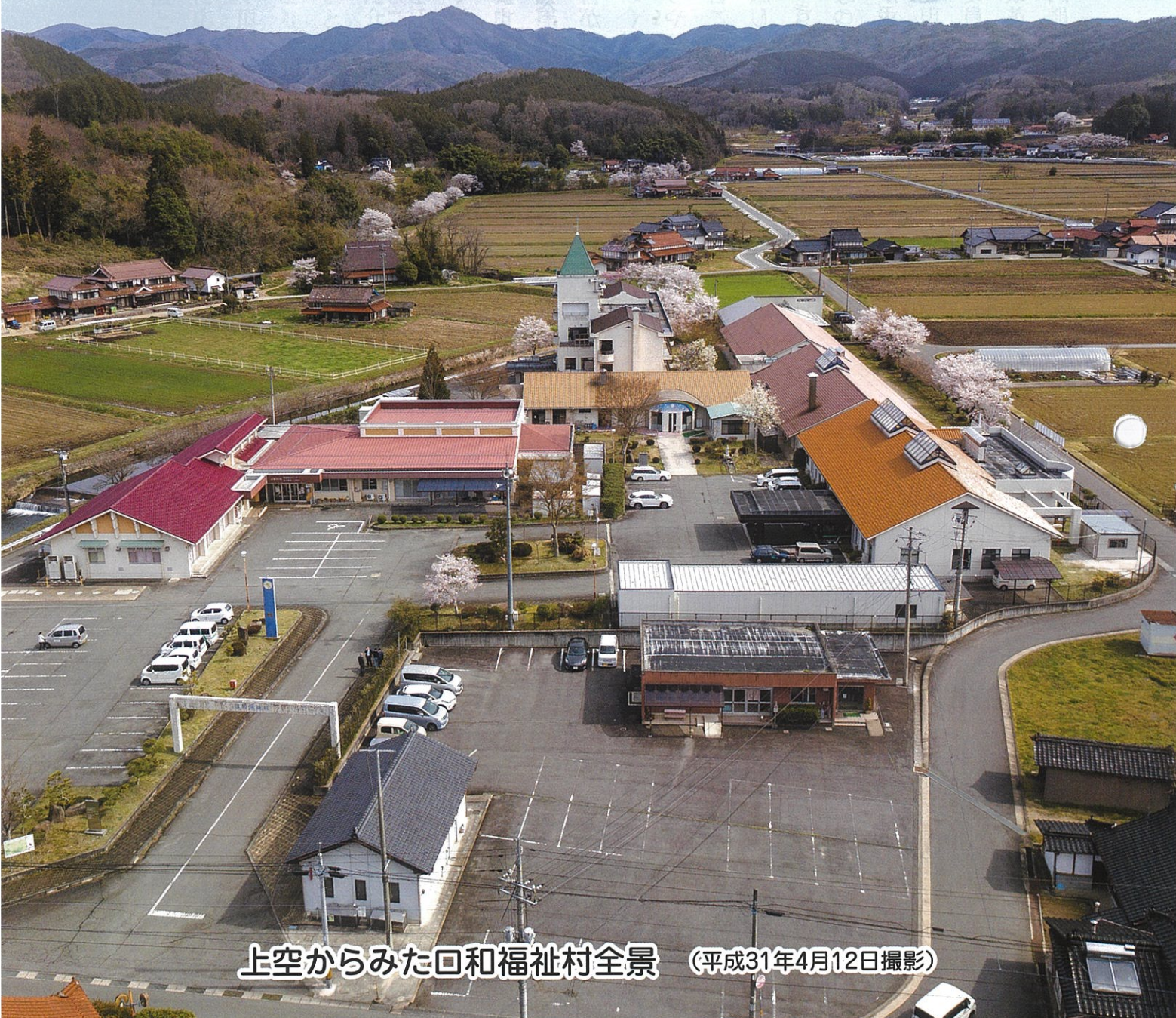
上空からみた口和福祉村全景 (平成31年4月12日撮影)